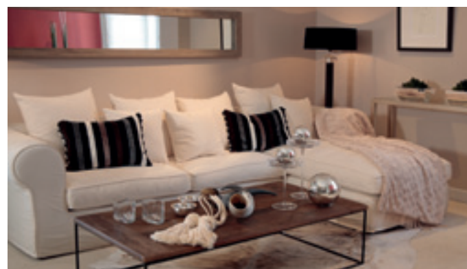
Auch für Planung, Beratung und Service gilt Andrea Hespeler's hoher Anspruch: „Eine individuell-perfekte Ausführung mit viel Liebe zum Detail.“